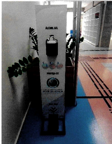
Figura 4: Nosso Totem de álcool