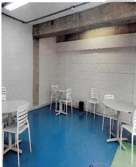
Figura 4: Fotos das salas de estudo