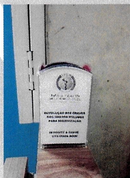
Figura 1: Devolução dos cadeados e chaves dos armários